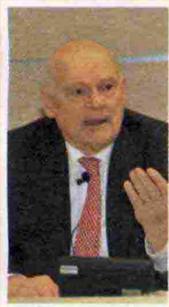
Viaggio nella Chiesa di Francesco